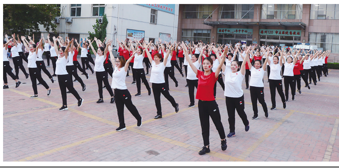
图为我院运动会集体操表演

金秋九月,天高云淡。28日下午,我院举行2019年秋季运动会。医院党委书记、理事长段立新及领导班子成员出席。各比赛代表队共计200余人参加。