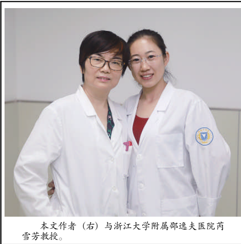
本文作者(右)与浙江大学附属邵逸夫医院药雪芳教授。

二零一九年秋,多事之秋,世界和平虽难实现,却是所有人的愿望。人类身体健康无疾终会到来,也是所有医生努力的方向。到那时,世无病人,亦无医生。学医第六步,吾所求也!